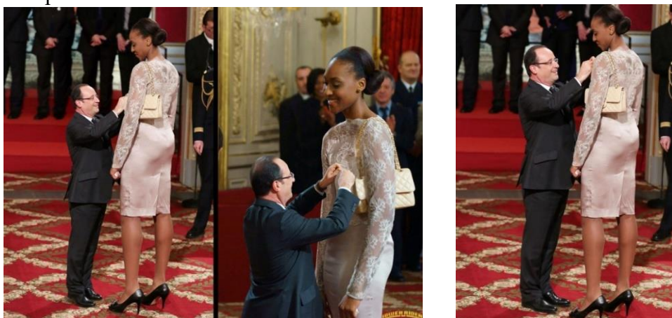
Рис. 1. Фотофейк «Фото Олланда с баскетболисткой взорвало Интернет»

Вторая новость, представленная в креолизованном формате, иллюстрирует нарушение закона противоречия: