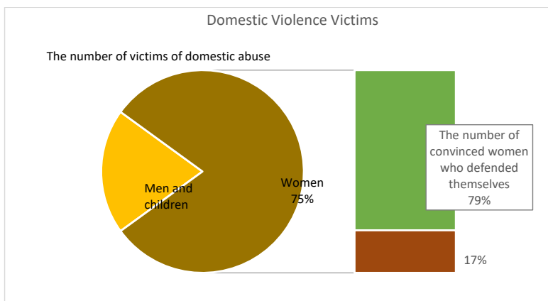
Picture 1. Percentage of female victims of domestic violence who tried to defend themselves

been subjected to violence that makes the advocacy work of human rights non-profit organizations even more important.