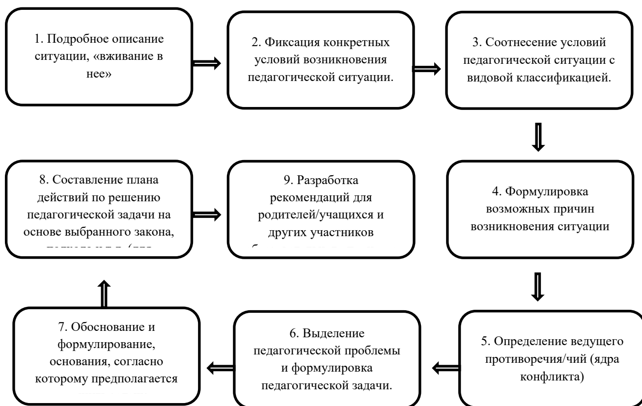
Рис. 1. Алгоритм решения ситуативной педагогической задачи

Разберем каждый этап представленного алгоритма подробно.