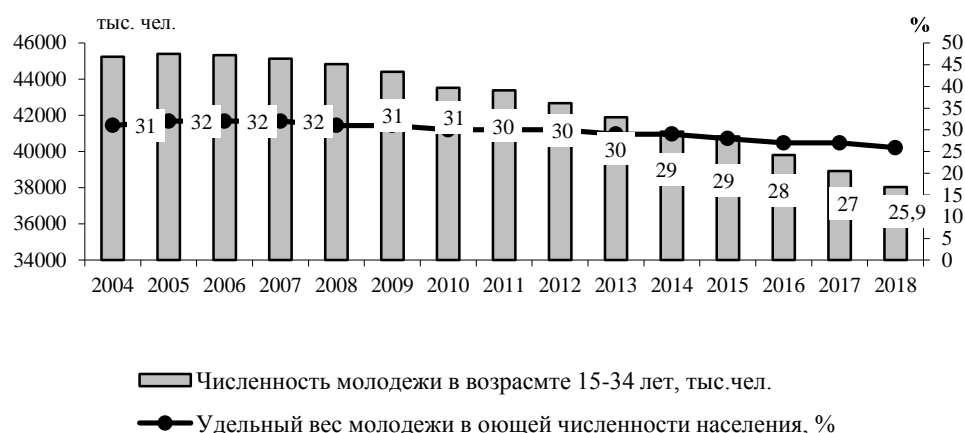
Рис. 1. Динамика и удельный вес молодежи (15-34 лет) в общей численности населения (на начало года), % [7]

Многие авторы, и с этим трудно не согласиться, подчеркивают особое, а порой и главное, значение образования в социальном развитии молодежи, в процессе приобщения молодежи к основным социальным ценностям [5]. Система образования развивает природные задатки и дает знания, квалификацию, необходимую для профессиональной деятельности, и тем самым способствует более полному использованию интеллектуального потенциала общества [6]. Она подготавливает молодое поколение к участию в принятии управленческих, политических, экономических и других решений. Отечественные и зарубежные экономисты выявили прямую зависимость между уровнем образования и уровнем ВВП, причем увеличение общественных и личных затрат на образование обеспечивает более половины прироста ВВП. Поэтому показатели потенциала образования стали частью системы показателей международной статистики [8].