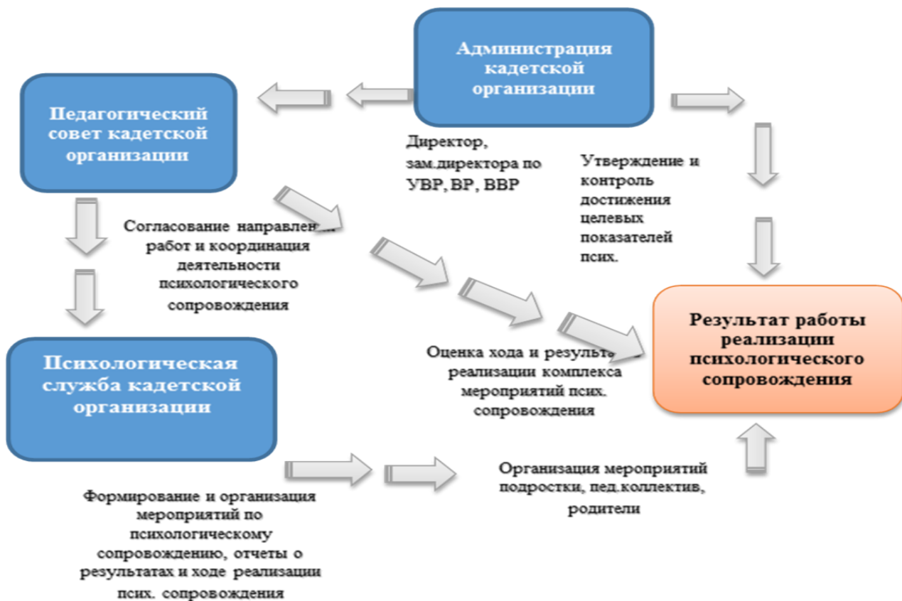
Рисунок 3. Модель управления психологическим сопровождением развития личности подростков в КОУ

Для эффективности психологического сопровождения нами была создана модель управления психологическим сопровождением, основной функцией которой являлась устойчивая, упорядоченная совокупность операций, основанная на разделении функциональных обязанностей в управляющей системе психологического сопровождения КОУ [Рисунок 3].