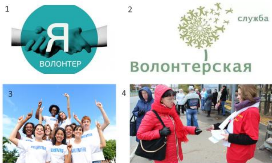
Рисунок 1. Визуальные образы волонтеров: 1 – привлекательное символическое изображение (1-е место), 2 – непривлекательное изображение (10-е место); 3 – привлекательное фото (1-е место), 4 – непривлекательное фото (10-е место)

3. Проведена оценка высокорейтинговых (1-е место) рисунков и фото и низкорейтинговых образов (10-е место) с помощью частного семантического дифференциала [Рисунок 1].