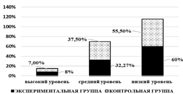
Рисунок 4 – Сравнение данных, полученных в результате опроса по анкете «Оценка готовности учителя начальных классов к профессионально-педагогической деятельности в поликультурном образовательном пространстве»