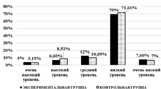
Рисунок 1 – Сравнение данных, полученных в результате опроса по модифицированной методике И.М. Юсупова, среди респондентов из экспериментальной и контрольной групп

согласно данным, полученным на основе использования четырех диагностических методик. Для решения задачи выявления уровня осведомленности учителей начальных классов по вопросам, касающимся особенностей проявления национальной идентичности у младших школьников, была использована модернизированная методика И.М. Юсупова (Рисунок 1). Для выявления способности учителей начальных классов общеобразовательных организаций отдельных регионов Северного Кавказа к саморазвитию в сфере обучения русскому языку как неродному использовалась модифицированная методика Т.И. Шамовой (Рисунок 2).