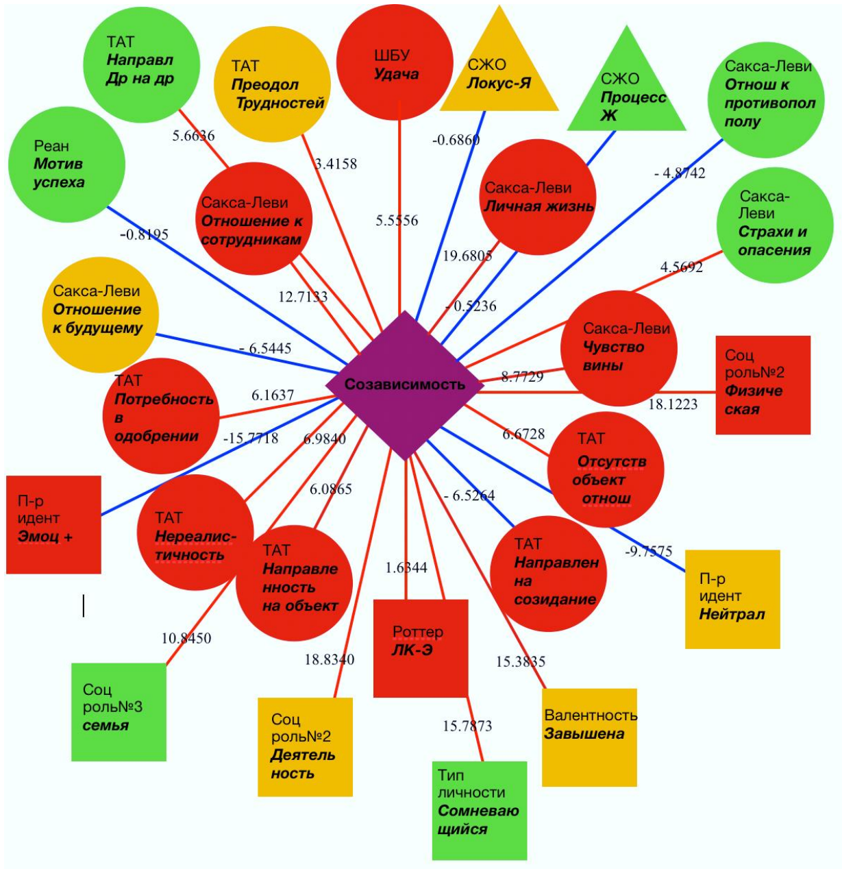
Рисунок 2. Регрессионная модель исследования ценностно-смысловой сферы относительно созависимости

Условные обозначения: где \Delta – высший уровень ценностно-смысловой сферы личности; \circ – средний уровень ценностно-смысловой сферы личности; \square – низший уровень ценностно-смысловой сферы личности; \bullet – уровень статистической значимости 0,001; \circ – уровень статистической значимости 0,01; \bullet – уровень статистической значимости 0,05