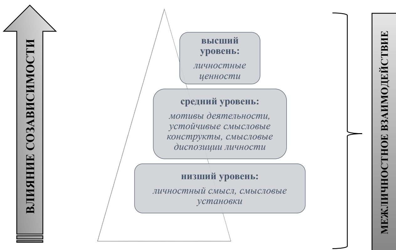
Рисунок 1. Модель ценностно-смысловой сферы созависимой личности

Руководствуясь логикой диссертационного исследования и учитывая информацию, полученную благодаря реферативному обзору, представленному в Главе 1, была предложена модель ценностно-смысловой сферы созависимой личности [Рисунок 1].