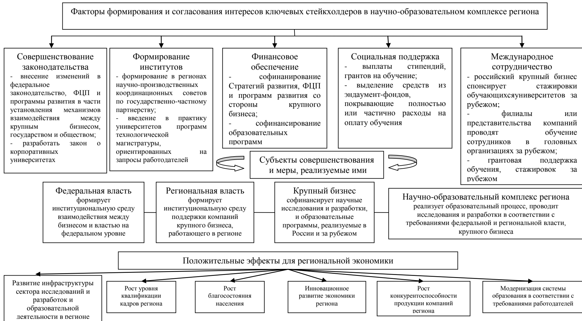
Рисунок 5 – Организационный механизм взаимодействия крупного бизнеса и региональных участников модернизационных процессов в научно-образовательном комплексе 18