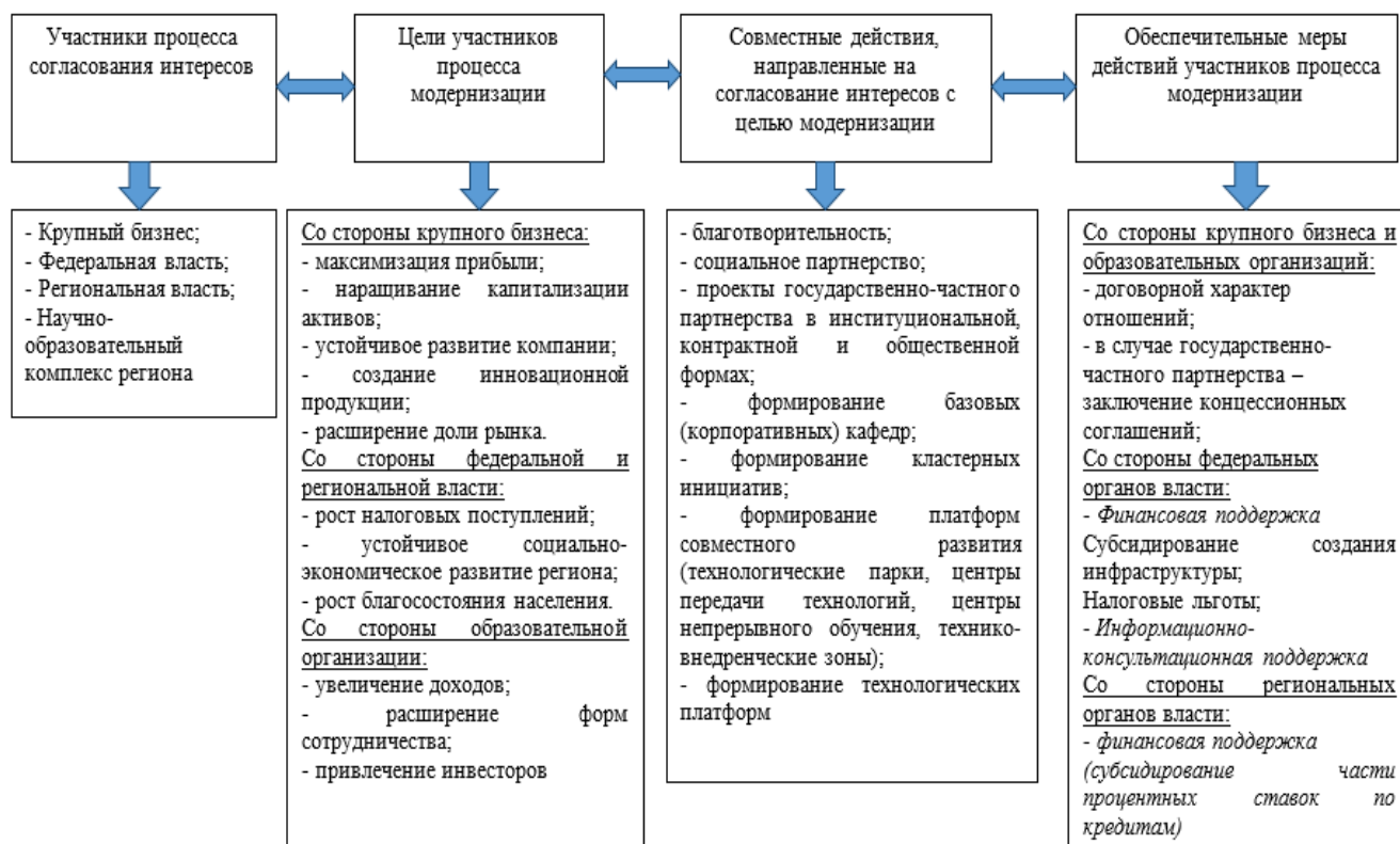
Рисунок 4 – Обеспечение мер взаимодействия участников процессов модернизации экономики региона 17

Представлен подход, согласно которому участниками согласования интересов в рамках политики модернизации экономики региона выступают компании, органы власти и инновационно-образовательные комплексы. Сопряжение интересов в данном случае достигается путем установления целевых ориентиров каждого из стейкхолдеров через взаимодействие с остальными участниками (максимизация прибыли, рост налоговых поступлений, повышение качества образования и т.д.). Инструментарием согласования интересов в рамках таких целевых ориентиров выступают различные формы взаимодействия (государственно-частное партнерство (ГЧП), корпоративные университеты, кластерные инициативы и проч.). Реализация таких практик возможна при наличии нормативного обеспечения процесса взаимодействия путем заключения концессионных соглашений, налогового льготирования и др. (рис. 4).