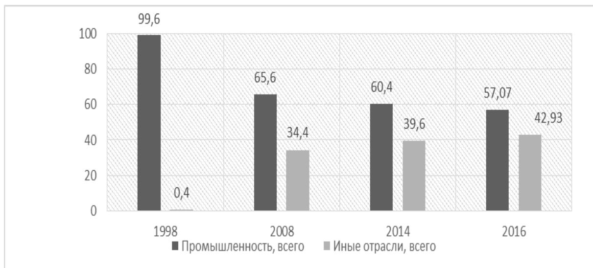
Рисунок 1 – Отраслевая динамика доли компаний крупного бизнеса в общем объеме выручки крупнейших компаний, % 10

Показано, что на современном этапе эволюции крупного бизнеса в России (начиная с 2015 г.), данный тренд начинает преломляться, и впервые рост модернизационного потенциала экономики регионов обнаруживается в отраслях промышленности. В качестве критерия, позволяющего исследовать формирование профиля экономики регионов и ее промышленной составляющей, был выбран показатель динамики выручки компаний, рассчитанный по отдельным отраслям экономики, на примере регионов Юга России.